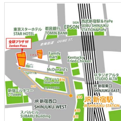
東京都新宿区西新宿1-4-11 全研プラザ 9F (JR新宿駅 西口から徒歩4分)

留学のお手続はもちろん、滞在先の手配から現地でのサポートまで、フルサービスでお世話をいたします。